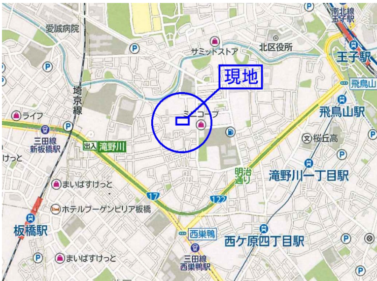
◎ 図面と現況が異なる場合は現況を優先とさせていただきます。

～内装工事の主な内容～ ●新規天井設置、埋込型ダウンライト取付 ●壁クロス工事(全室) ●床工事 (洋室、DK:フローリング/洗面室・トイレ:CF) ●浴室交換(浴室換気乾燥機 追炊機能) ●トイレ交換(温水洗浄便座) ●システムキッチン+レンジフード 交換 ●洗面台交換 ●木枠他塗装工事 ●給水・給湯管交換(一部) ●電気 工事/アンペア増設(40A)、配線工事他、エアコン、アイフォン取付工事 etc.